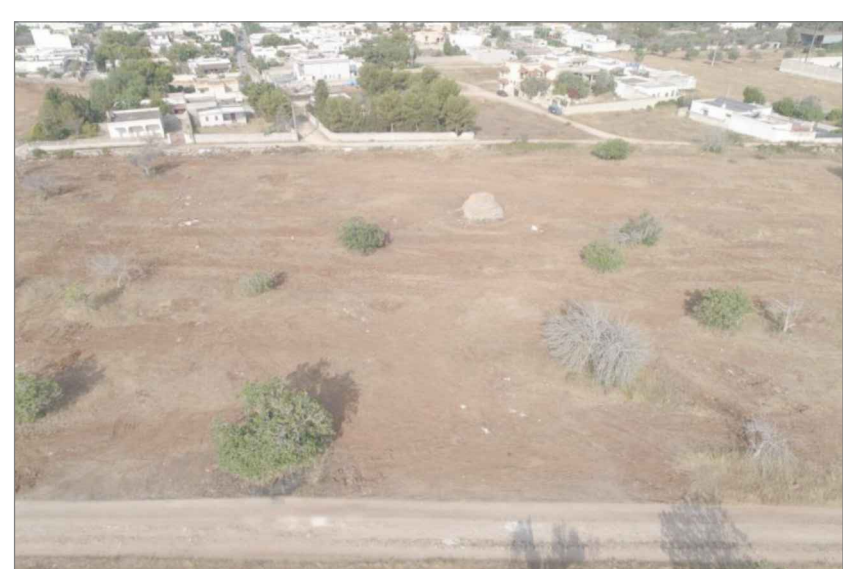
agg. fotografico anno 2021