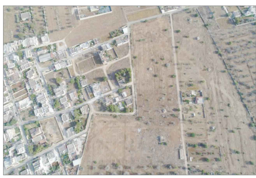
agg. fotografico anno 2021

GIUSEPPE QUARTA ARCHITETTO VIA VECCHIA 7 - 70048 LECCE (LE) TEL. 0832.420011 - 0832.420012 WWW.GIUSEPPEQUARTA.COM