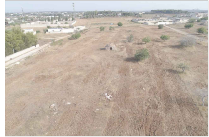
agg. fotografico anno 2021