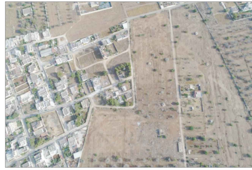
agg. fotografico anno 2021

VIA GRECI, 7 - 73045 LEVERANO (LE) pec. giuseppe.quarta@libero.it tel. +39 0832 440753 p. r. - 01175440753