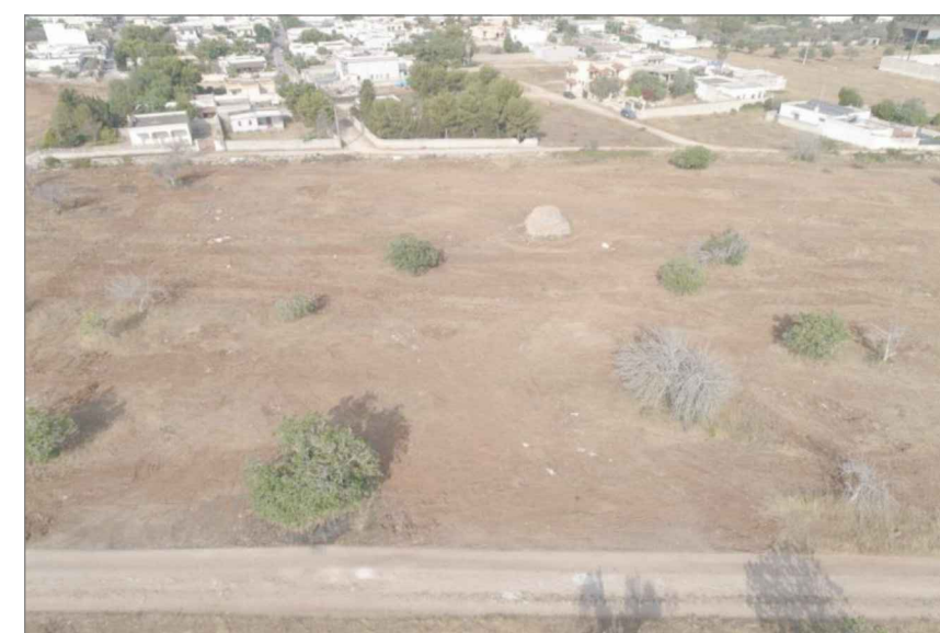
agg. fotografico anno 2021