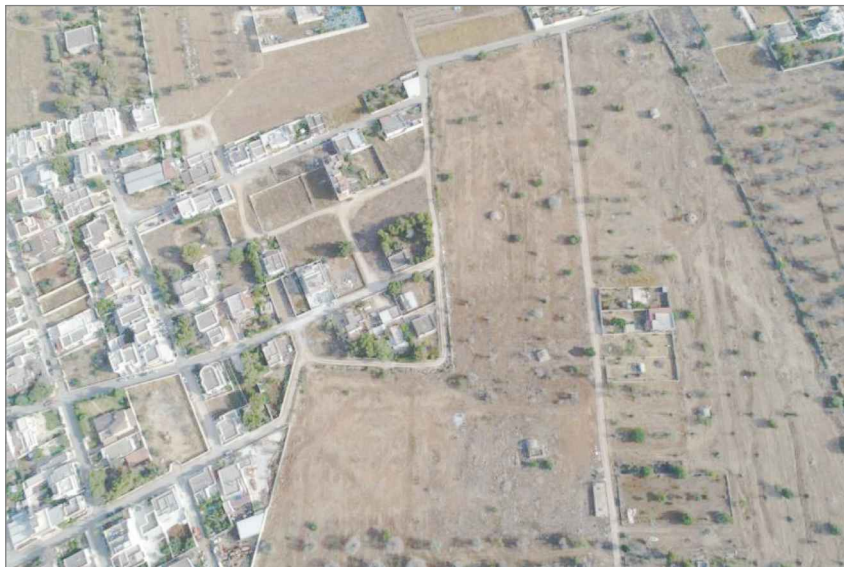
agg.fotografico anno 2021

VIA GRECI, 7 - 73045 LEVERANO (LE) pec. giuseppe.quarta@archiworldpec.it mail. marti.mari@tiscali.it