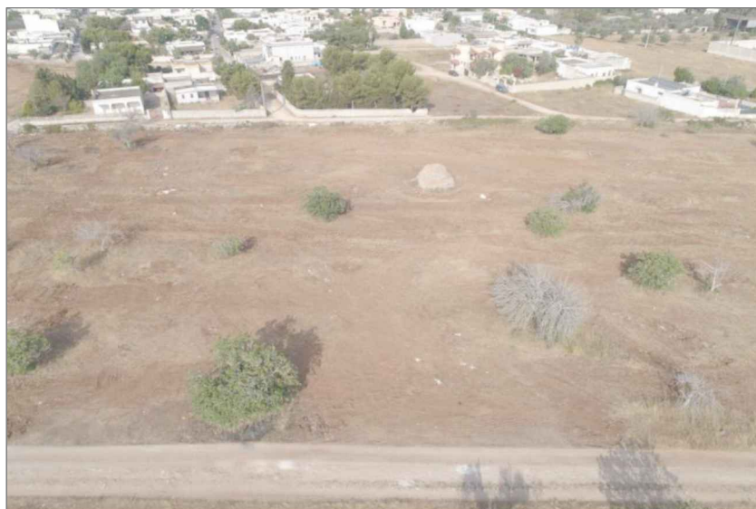
agg.fotografico anno 2021