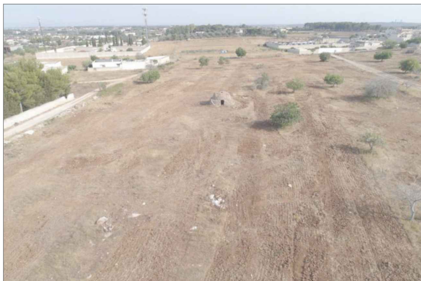
agg.fotografico anno 2021